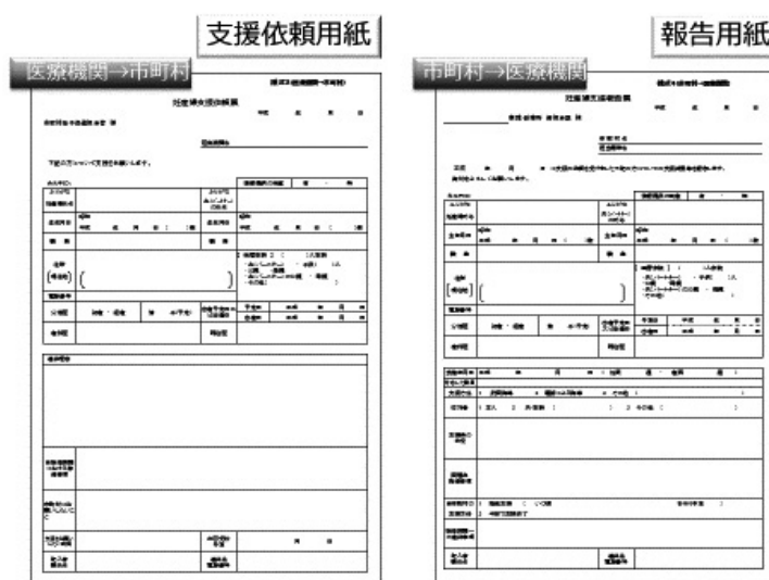
図2 秋田県による医療機関と市町村連携で使用される依頼票および報告票

以上の結果から、本事業が県内に浸透しつつあること、産婦人科医療機関と市町村の連携が円滑に行われていること、そして、本事業に対して、特にコメディカルスタッフの意欲が増していることが伺えた。今後の課題としては、支援される側の声を聞く、子育て支援エキスパートを育成する、地域ぐるみの子育て支援活動の強化などが挙げられる。